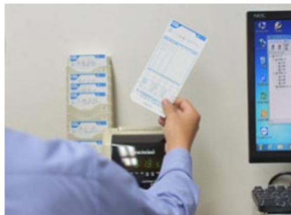
1分単位での残業手当支給