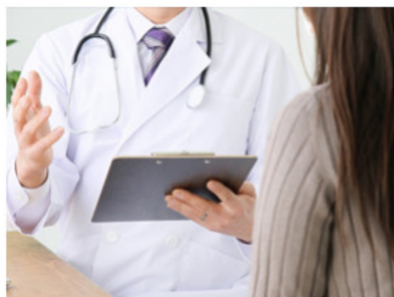
費用会社負担による人間ドッグ受診