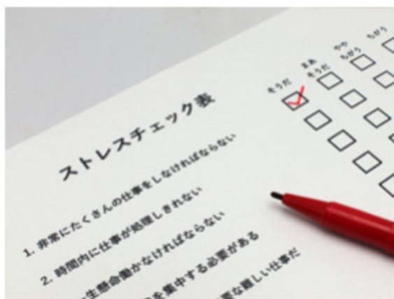
ストレスチェックの実施