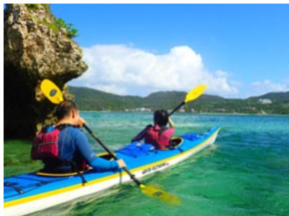
有給休暇取得の促進