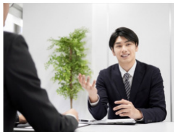
社長宛て質問・要望書の提出

社員一人ひとりが個性や能力を発揮し、働き続けるためには、心身ともに健康であることが大切だと私たちは考えています。そのため、VTホールディングス株式会社では、特定の年齢に達した方が、受診費用会社負担にて人間ドッグを受診できる等、社員自身が元気に長く働き続けられる環境作りに取り組んでいます。また、社長宛ての質問・要望書の提出をすることができ、意見の言いやすい、働きやすい会社を目指しています。